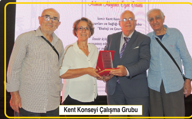
Kent Konseyi Çalışma Grubu